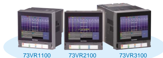
図2 タッチパネル式チャートレス記録計73VRシリーズ

73VRシリーズは、そのタッチパネルによる操作性の良さについてお客様からご評価いただいています。