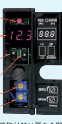
図2 M2MSTの前面パネル図