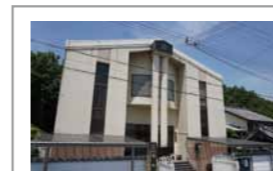
浄土真宗 高松寺 〒651-1233 神戸市北区日の峰2-16-1

これなら蛍光灯を取り替える要領で取り付けるだけで誰でも簡単に交換出来るでしょう。電気代もほぼ半分になるようだ。蛍