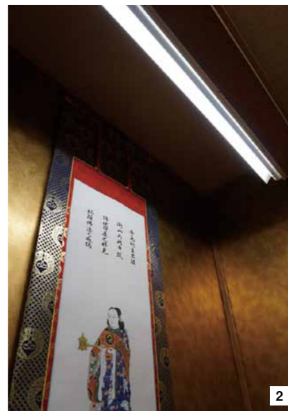
①本堂の照明は全てエム・システム技研の万能直管LEDライトに替えられた ②LEDは紫外線が出ないので本尊も掛け軸も照明による劣化の心配が要らない ③地域のギャラリーとしても親しまれている本堂の天井の高さは約3メートル。蛍光灯と違いLEDは長寿命なので交換の手間がほぼなくなった ④谷川弘顕住職